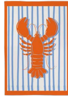
3. GESCHIRRTÜCHER je 7,95