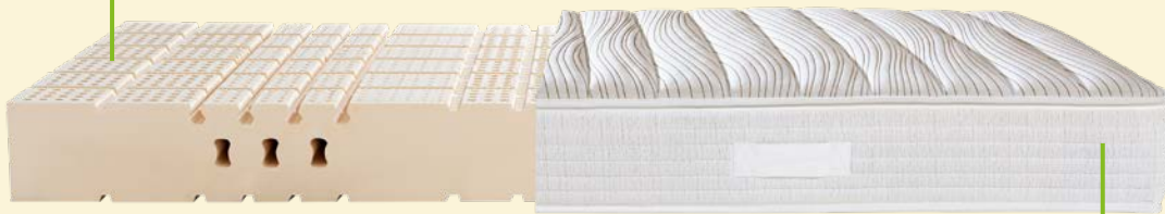
7. MATRATZE DORMABELL CLASSIC L WOOL 1.349,-

Der Matratzenkern aus 100 % FSC®-zertifiziertem Naturlatex passt sich optimal an den Körper an und verbessert die Schlafqualität spürbar.