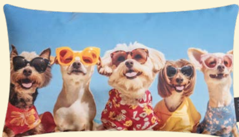
4. DEKOKISSEN 19,95

” UNSER TREND-TIPP: SONNIGE DESSINS FÜR TRAUMHAFTE MOMENTE. ”