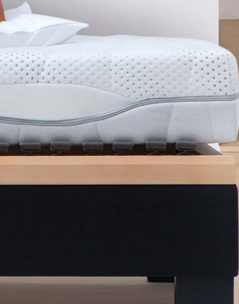
1. MATRATZE DORMABELL CLASSIC S CLEAN 679,-