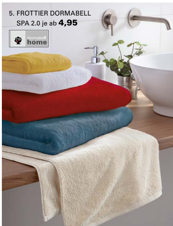
5. FROTTIER DORMABELL SPA 2.0 je ab 4,95