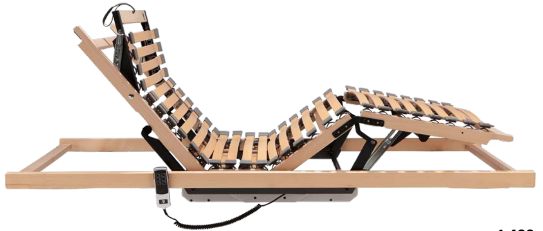
3. RAHMEN DORMABELL CLASSIC M2 K 1.499,-