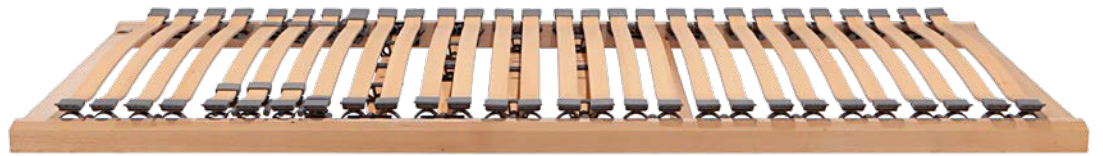
2. RAHMEN DORMABELL CLASSIC N 479,-